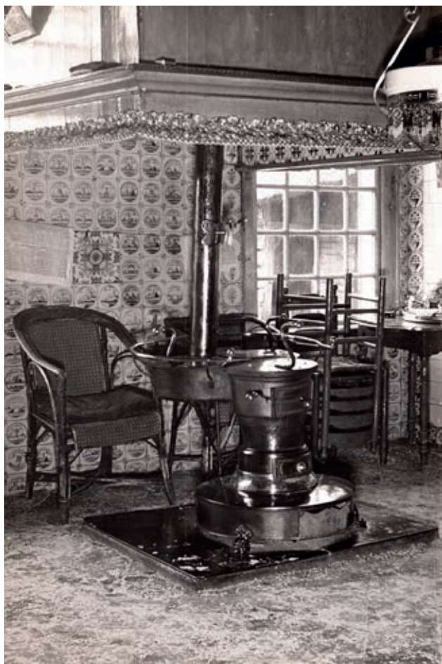
Oorspronkelijke inrichting Staphorst

Er zijn meerdere criteria om een object of een interieur te waarderen. Enkele veel gehanteerde criteria zijn de presentatiewaarde, de gebruiksgeschiedenis, compleetheid, conditie, authenticiteit, plaats tussen andere interieurs van dezelfde herkomst en tot slot de wetenschappelijk waarde (oftewel; is het interieur een betrouwbare bron voor de studie naar de, in dit geval Staphorster, wooncultuur, dan wel is het conform de meest recente inzichten?).