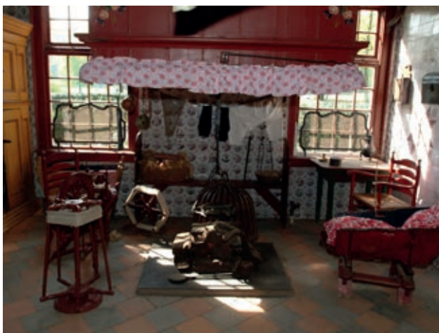
Inrichting Staphorst Nederlands Openluchtmuseum

Tot slot was er een aantal zaken dat qua vorm weliswaar beantwoordde aan het beeld van het museum, maar niet qua beschildering. Om de gewenste notenhoutimitatie te realiseren, stuurde het museum de Arnhemse schilder W.D.G. Lucas naar Staphorst, waar hij een paar adressen bezocht. Met die kennis op zak heeft hij delen van de wandbetimmering in de zijkamer, een spinde, een vogelkooitje en een hoekkast 'geneuteboomd'. Deze zeer verschillende voorwerpen van eveneens verschillende herkomst werden zo getransformeerd tot - ogenschijnlijk - één geheel. De schildertrant van Lucas is echter zowel qua materiaalgebruik als qua opbouw en houtnerftekening niet typisch voor Staphorst. De beschildering van twee beschikbare kledingkasten was te jong. Zij droegen initialen van eerdere gebruikers en respectievelijk de jaartallen 1921 en 1927. De ene kist werd rood overschilderd, de andere opnieuw 'geneuteboomd'. Op deze wijze geantidateerd en geanonimiseerd, werden zij in het gewenste beeld geperst.